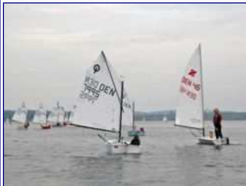
Optimist (à gauche)